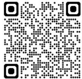
Der lange Weg zur neuen Sorte, KWS

Wie ist das denn nun mit dem Saatgut? Ein Beispiel: Die KWS zeigt auf ihrer Webseite, wie Der lange Weg zur neuen Sorte aussieht.